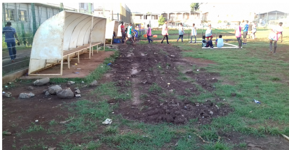
Stade de Combani (sources : Ambass, 2019)

Aussi, depuis la création du club à Combani, les équipes se sont entraînées sur du gazon naturel mais en saison de pluies, la pratique est impossible. Les conditions d'apprentissage ne sont pas adaptées pour mieux préparer les clubs à rivaliser avec les équipes réunionnaises et métropolitaines.